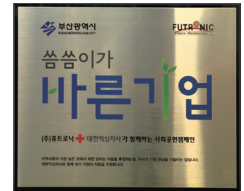
50만원 이상 후원