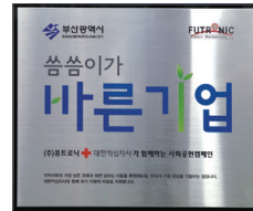
20만원 이상 후원